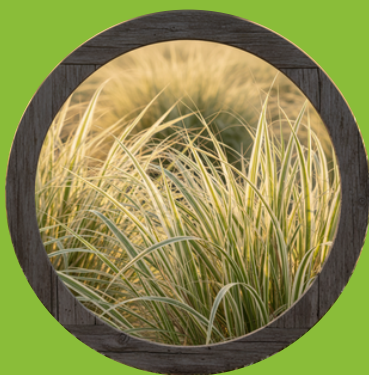
Ruban de Bergère